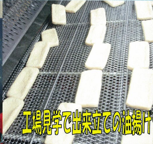
工場見学で出来立ての油揚げや厚揚げも試食しました！