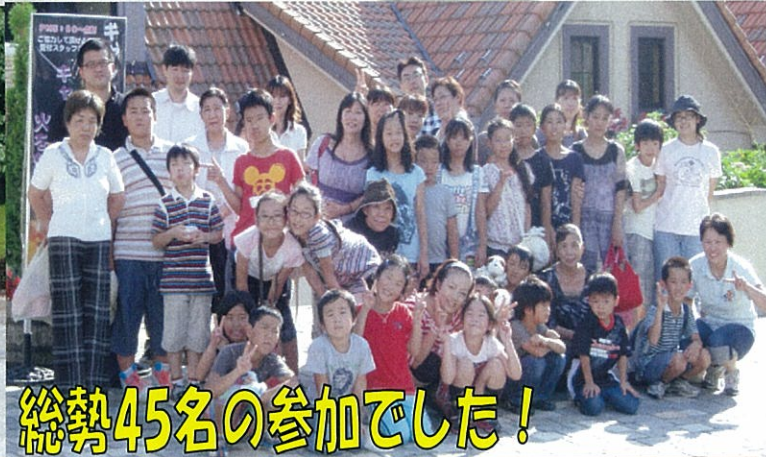
今回参加者の皆様です。総勢45名の参加でした！