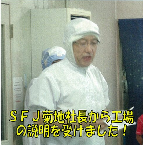
SFJ菊地社長から工場の説明を受けました！