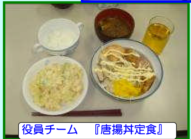
役員チーム 『唐揚げ定食』