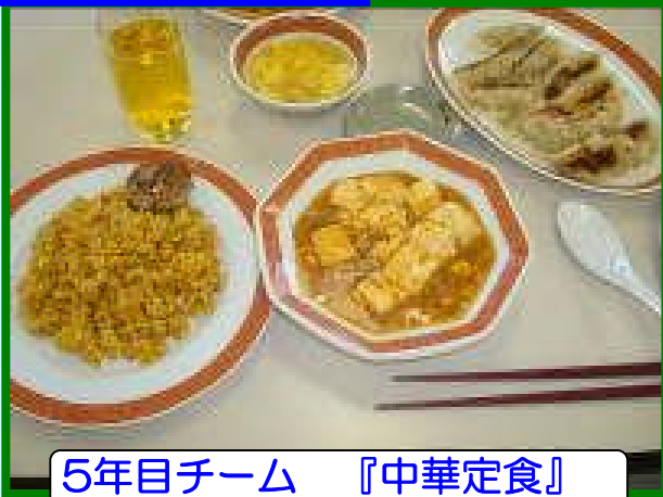
5年目チーム 『中華定食』